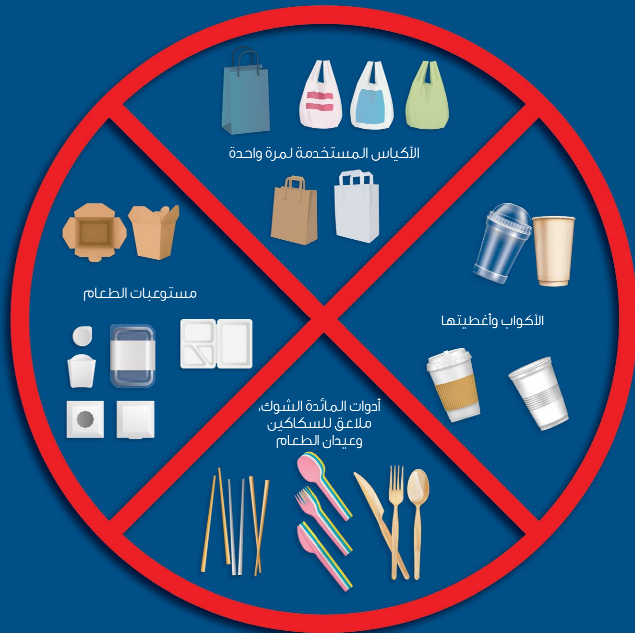
الشكل 1: قائمة بالمواد المستخدمة لمرة واحدة التي يشملها الدليل